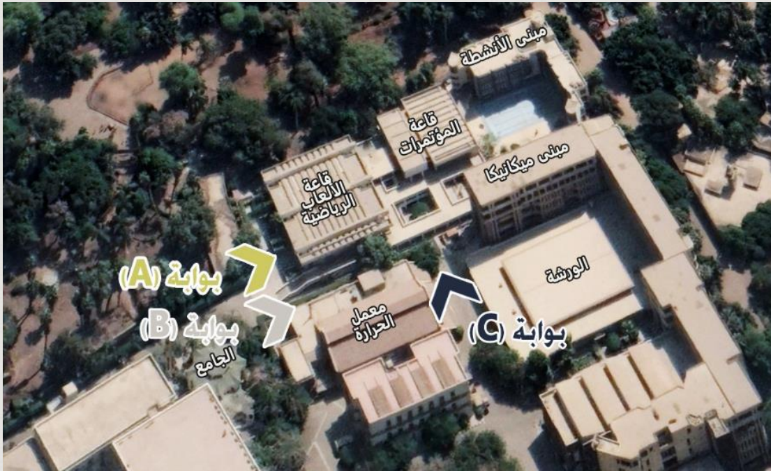
شكل يوضح أماكن مداخل المعرض