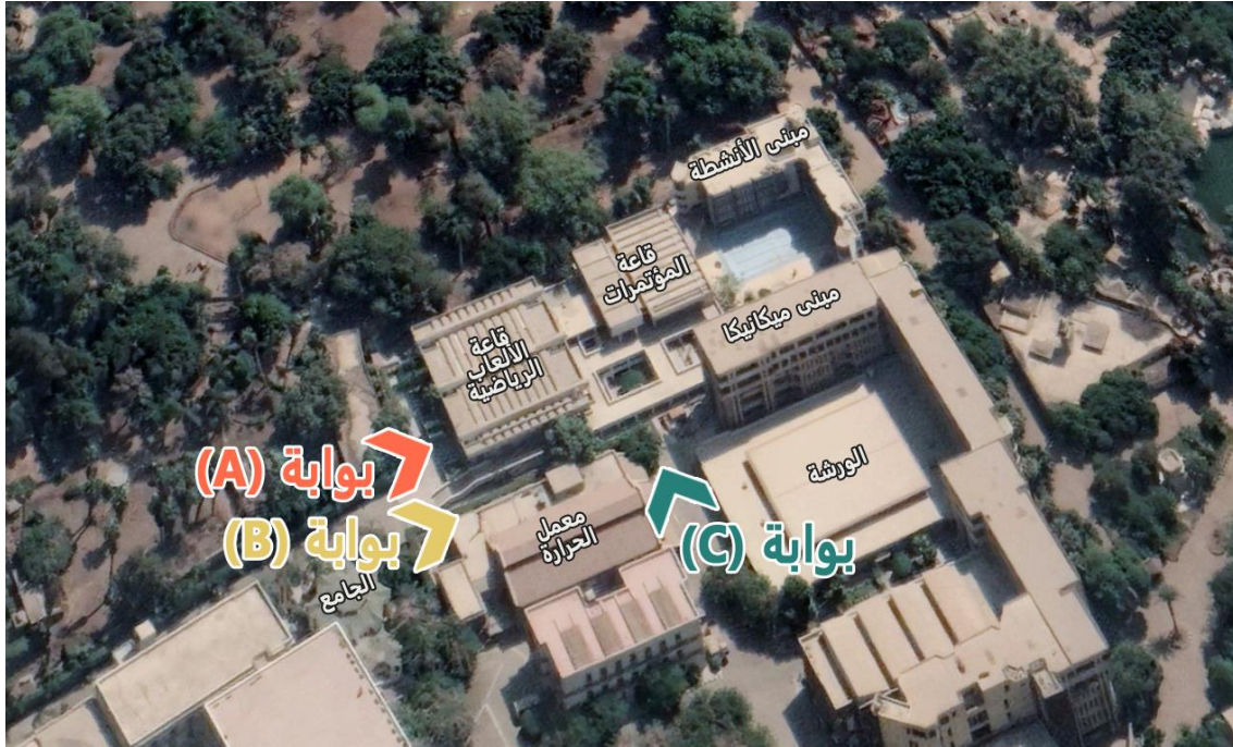
شكل يوضح أماكن مداخل المعرض