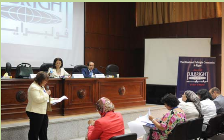
المؤتمر السنوي لخريجي هيئة فولبرايت