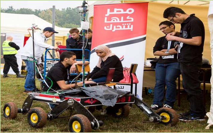
فريق الكلية المشارك في مسابقة European Rover Challenge