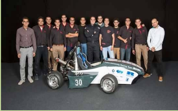
فريق هندسة القاهرة المشارك في مسابقة فورميلا وان بألمانيا