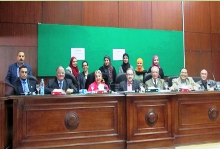
مسابقة اختيار الطالب المثالي على مستوى الكلية