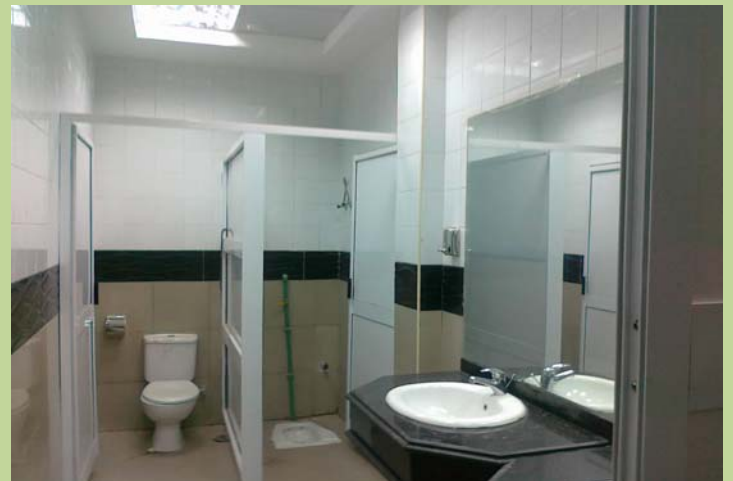
دورة المياه الحريمي بمبنى الإدارة بعد أعمال الإحلال والتجديد