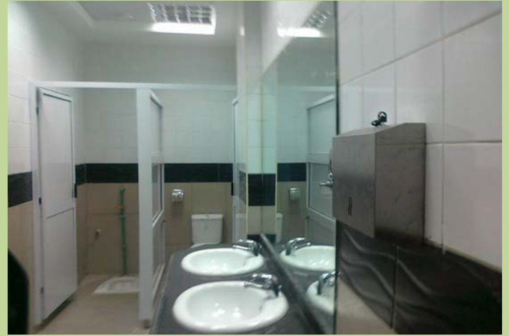
دورة المياه الرجالي بمبنى الإدارة بعد أعمال الإحلال والتجديد