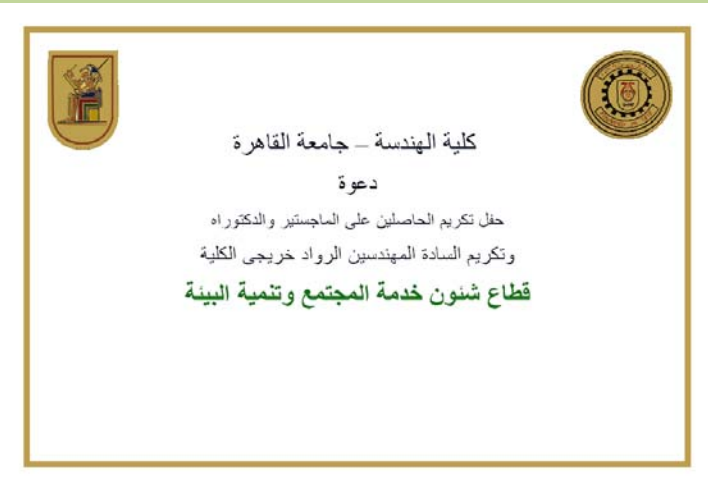
الواجهة الأمامية للمظرف الخاص بدعوة الحفل