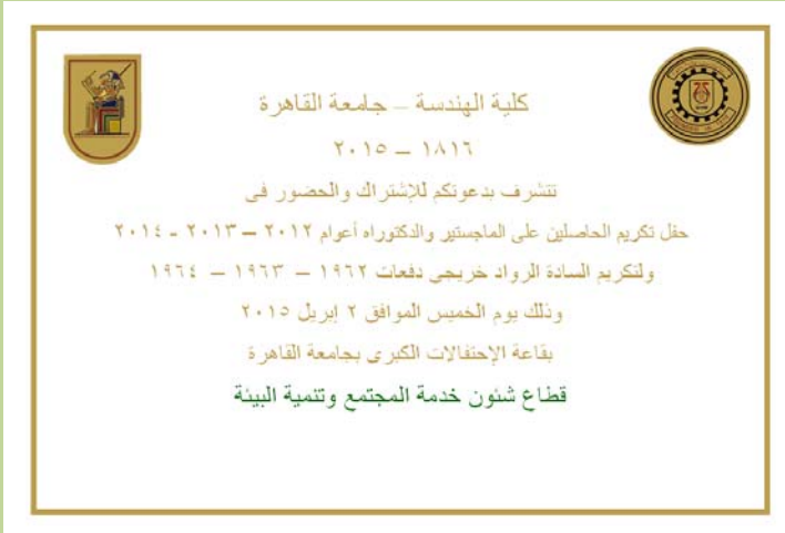
الواجهة الأمامية لبطاقة دعوة الحفل للسادة المكرمين