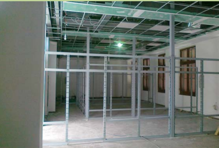
بدء تركيب الفواصل الداخلية للمراكز بالدور الثاني بالمبنى