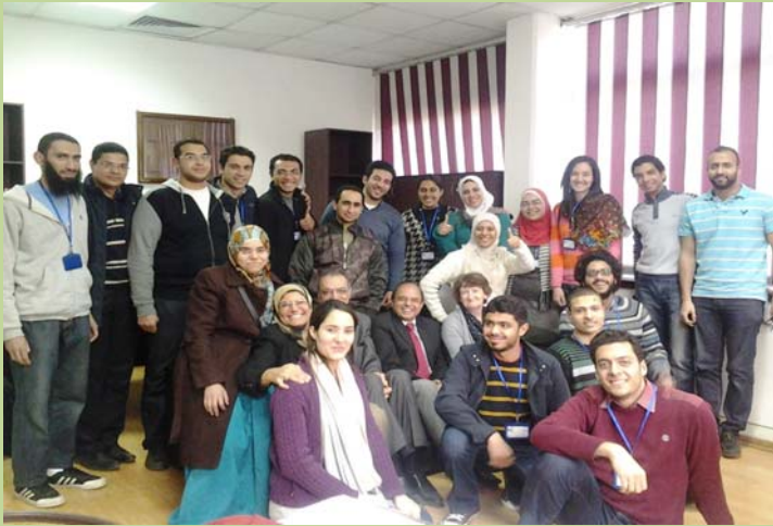
المشاركون في الدورة التدريبية - مركز تهيئة فرص العمل