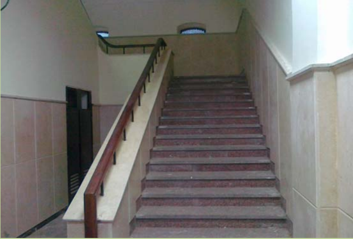
درايزين السلم الجنوبي