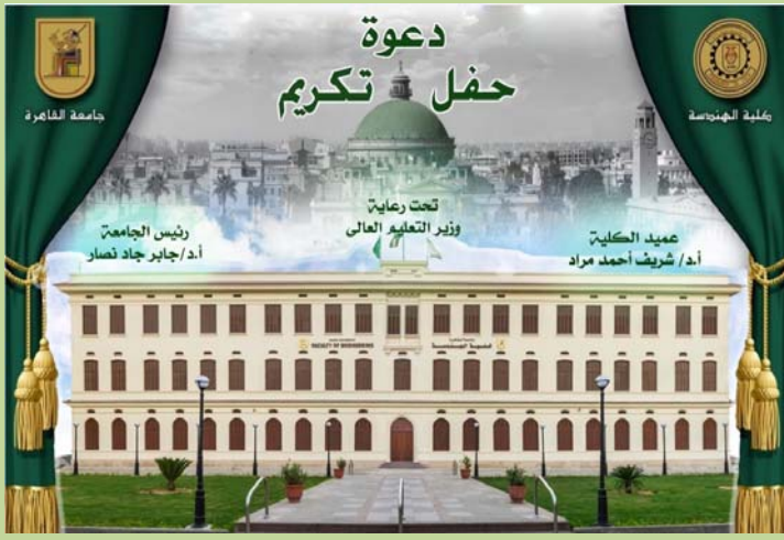
الواجهة الخلفية لبطاقة دعوة الحفل للسادة المكرمين والسادة المدعوين