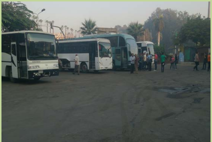
اتوبيسات نقل طلاب السنة الإعدادية ( الجراج الخارجى للكلية )