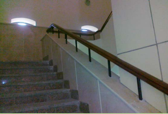
درايزين السلم الشمالي