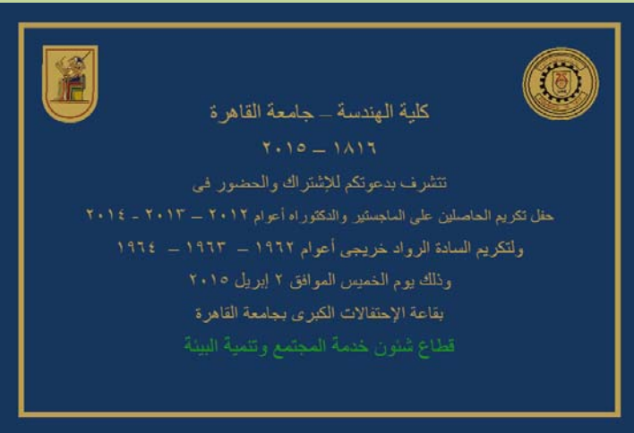
الواجهة الأمامية لبطاقة دعوة الحفل للسادة المكرمين