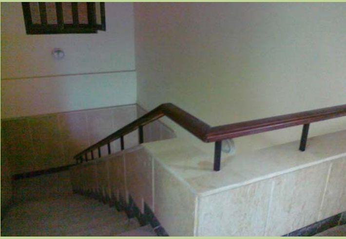
درايزين السلم الاوسط