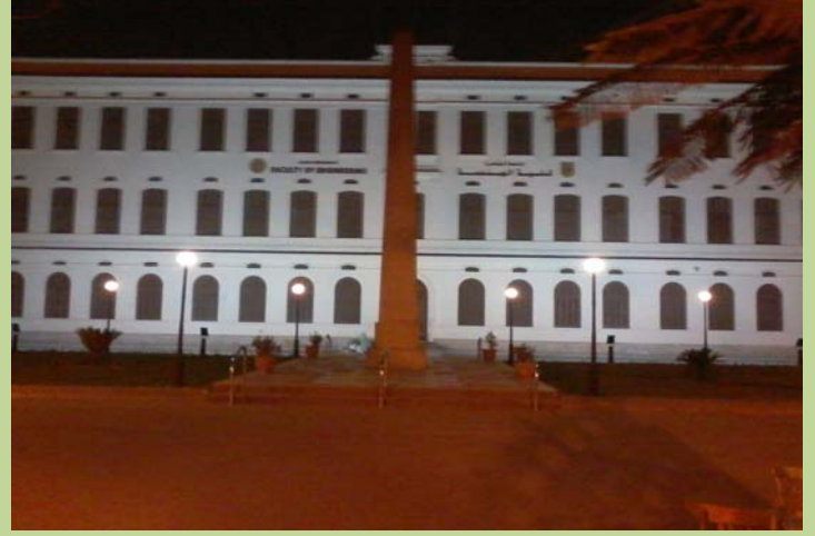
واجهه مبنى الادارة أثناء الليل