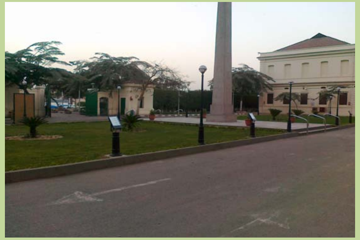
كشافات إنارة واجهه مبنى الإدارة ليلاً